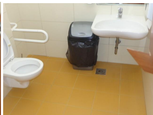
Slike 18 do 22 Oprema WC-a suterena