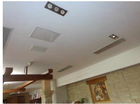
Slike 11 do 15 Fan coili, kasetne jedinice.....