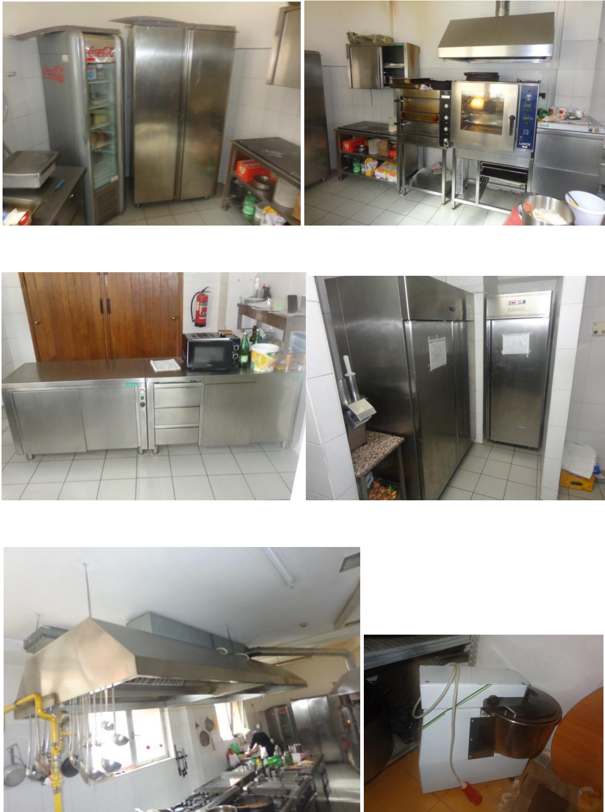
Slike 39 do 44 Oprema kuhinje: zamrzivač, frižider, inox pult i ormari, napa, stroj za tjesto