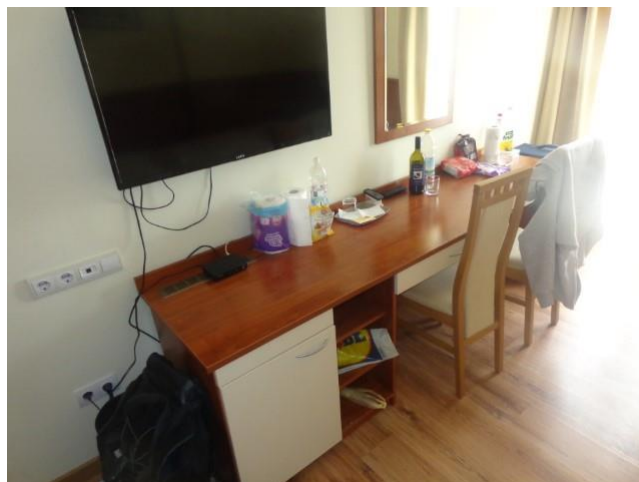
Slike 50 do 52 Oprema soba.