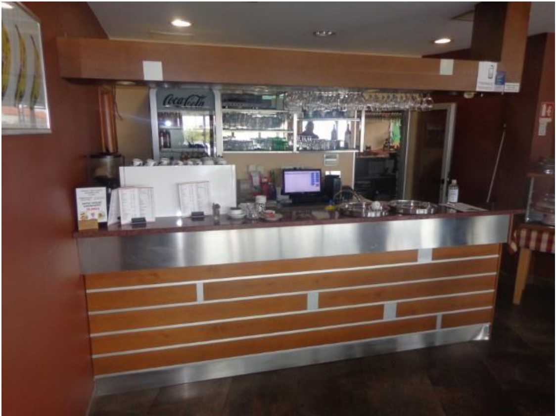
Slike 31 I 32 Oprema café bara I restorana: šank sa sudoperom I inox pult sa spremištem