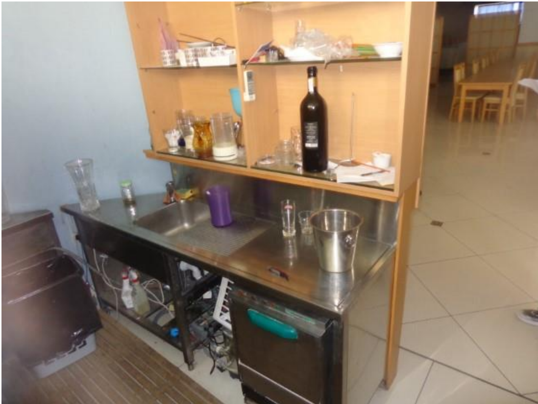
Slike 23 I 24 Oprema dvorane (suteran) pultevi sa sudoperom i kutni