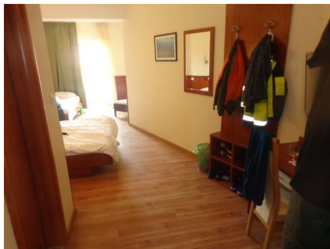
Slike 45 do 49 Oprema soba.