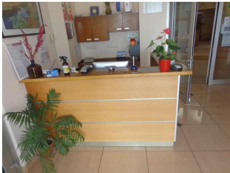
Slike 16 I 17 Recepcijski pult I ugradbeni ormarići krilni I viseći