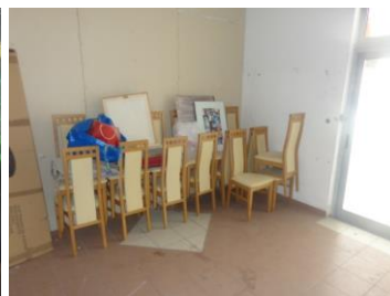
Slike 15 do 30 Stolovi i stolice opreme dvorane (na više lokacija)