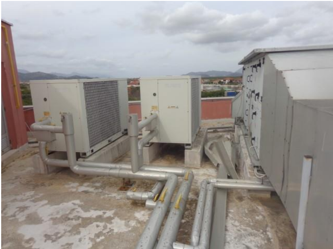
Slike 9 i 10 Klima komore i dizalice topline