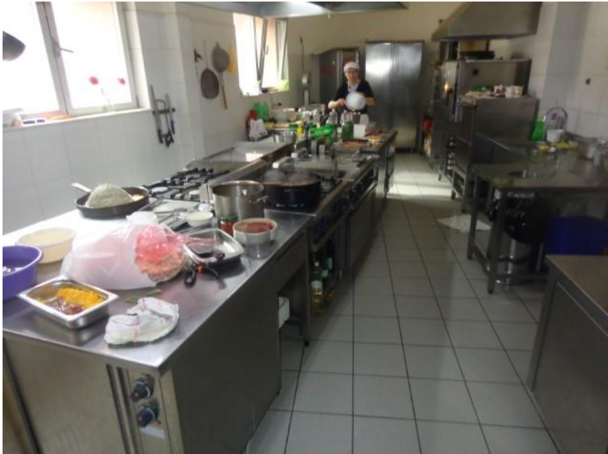
Slike 37 I 38 Oprema kuhinje: sudoperi, štednjak, roštilj , friteza