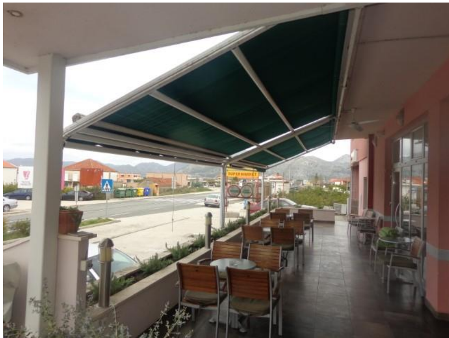
Slike 4 do 8 Dizalo putnika, kuhinje, rampa za invalide i tenda