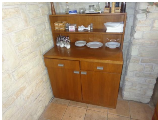
Slike 33 do 36 Oprema café bara I restorana: pult drveni I ormari za inventar