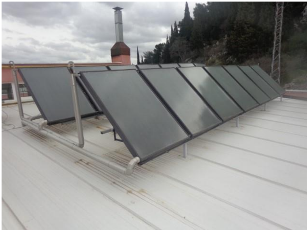
Slik 1, 2 i 3 Bojleri, plinski kotao, solarni kolektori